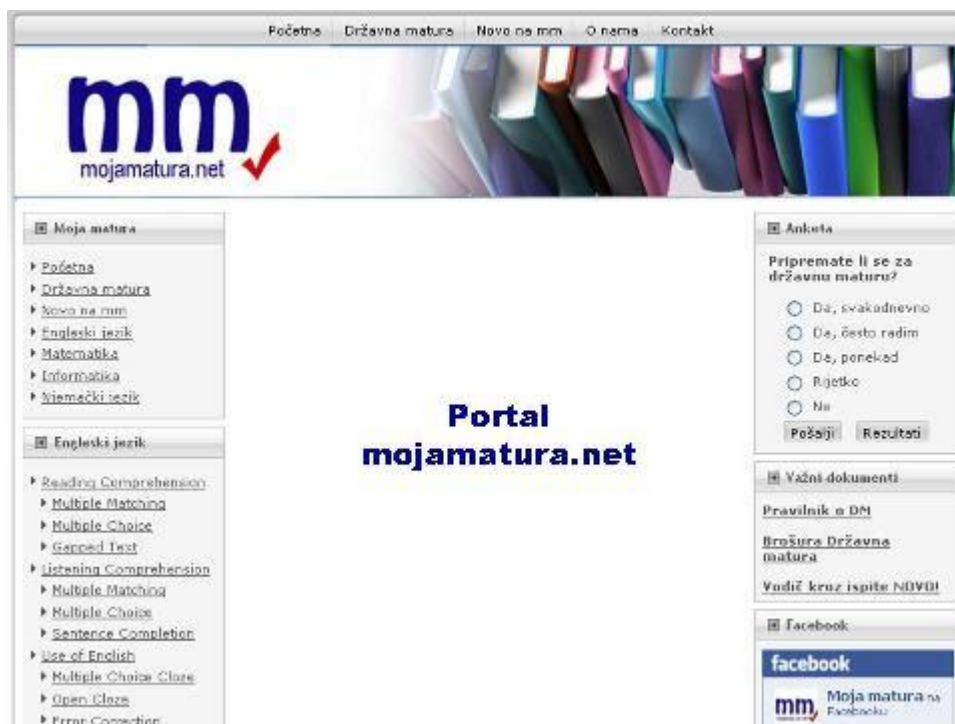
Slika 2. Prezentacija portala

Portal se u ožujku 2010. plasirao u finale natjecanja „Primjena računala u obrazovanju“ koje se organizira od 2007. godine u suradnji Agencije za odgoj i obrazovanje, Hrvatske akademske i istraživačke mreže CARNet i Microsofta Hrvatska te uz potporu Ministarstva znanosti, obrazovanja i športa. Možemo se pohvaliti da je naša profesorica njemačkog i engleskog jezika, Arjana Blažić, voditeljica projekta Greetings from the World koji je pobijedio na spomenutom natjecanju. Ona će u studenom predstavljati Hrvatsku na Svjetskom forumu inovativnog obrazovanja u Cape Townu.