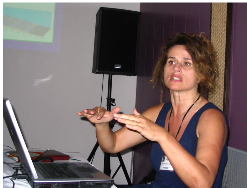
INVAZIVNE VRSTE U JADRANU