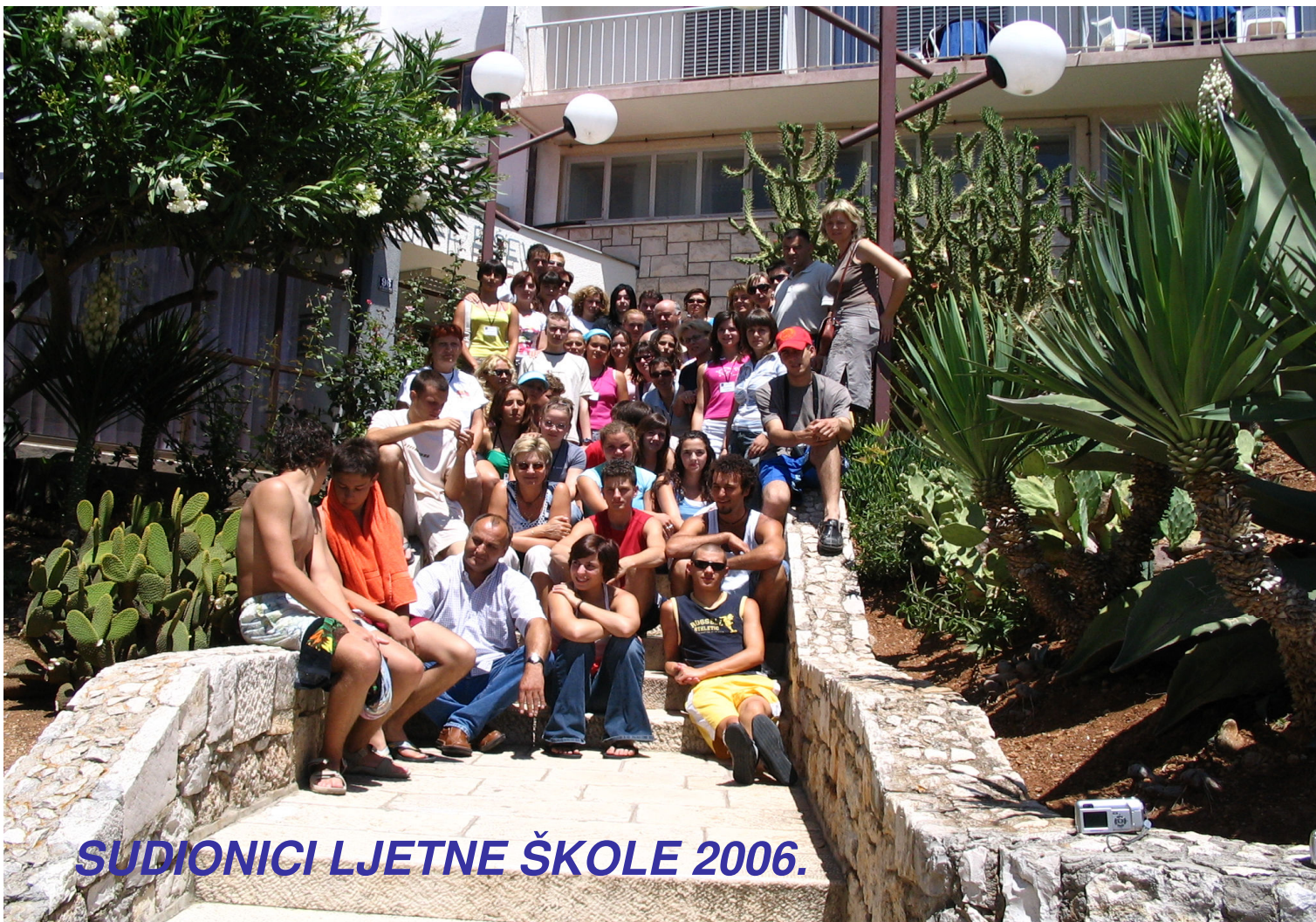
ŠKOLNICI LJETNE ŠKOLE 2006.