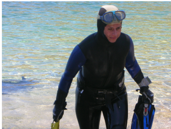
ŽIVOT U MORU