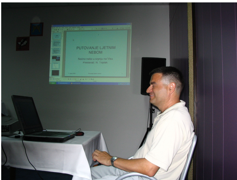
PUTOVANJE LJETNIM NEBOM