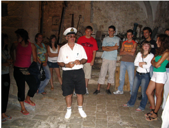
RIBARSKI MUZEJ I GAJETA FALKUŠA